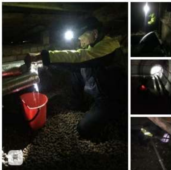
16.10.2020 г. Пушкин, Лебединая ул. 14/3 Ликвидация воздушных пробок на стояке ЦО.