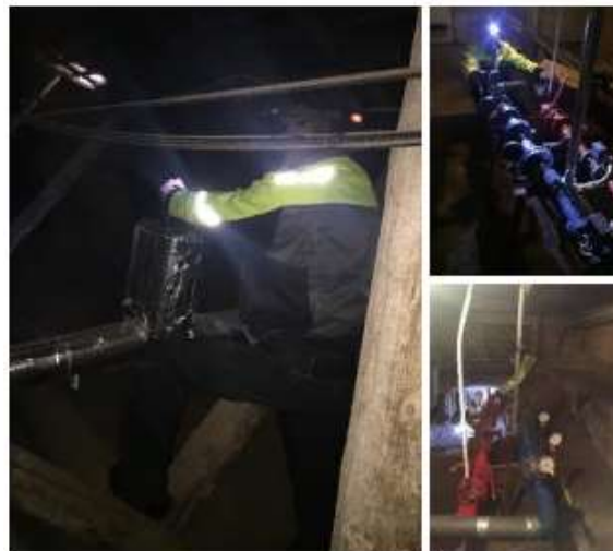
16.10.2020 г. Павловск, Толмачева ул. д. 9 Ликвидация воздушных пробок на стояке ЦО.