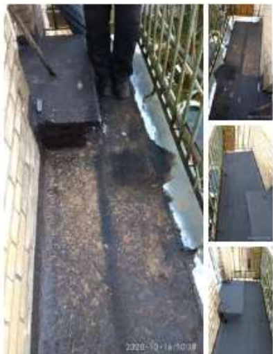
16.10.2020 г. Пушкин, Октябрьский б. д.48 выполнены работы по установке запорной арматуры д.50