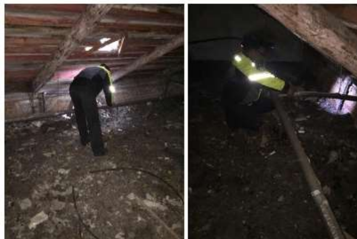
16.10.2020 г. Павловск, Лебединая ул. д. 16 Ликвидация воздушных пробок на стояке ЦО.