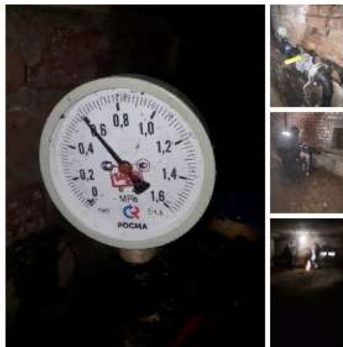
16.10.2020 г. Павловск, Березовая ул. д. 8 Ликвидация воздушных пробок на стояке ЦО.