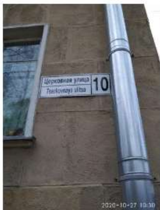
27.10.2020 Восстановление освещения г. Пушкин, Церковная ул. д. 10