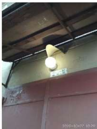
27.10.2020 Замена стояка ЦО, замена радиатора, стояк залуцен г. Павловск, Гуммолосаровская ул. д. 11 -3.