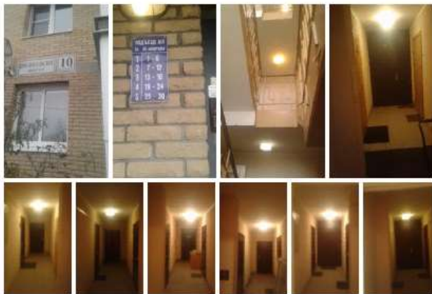
26.10.2020 Ремонт доводчика г. Пушкин, Ленинградская ул. д. 57 пар 4.