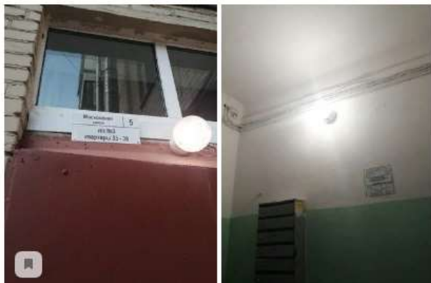
28.10.2020 Восстановление ЦО, замена вентиля г. Пушкин, Октябрьский б-р.