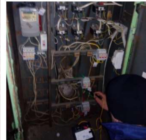
21.04.2021 Замер сопротивления изоляции г. Пушкин, Ленинградская ул. д. 19 #жкс2пушкин