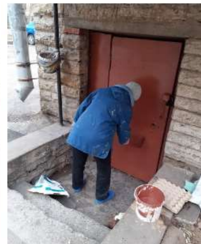
05.04.2021 Окраска входной двери г. Пушкин, Магазиная ул. д. 62 #жкс2пушкин