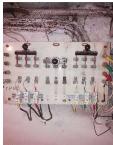
19.04.2021 Замер сопротивления изоляции. г. Пушкин, Ленинградская ул. д. 18 #жкс2пушкин