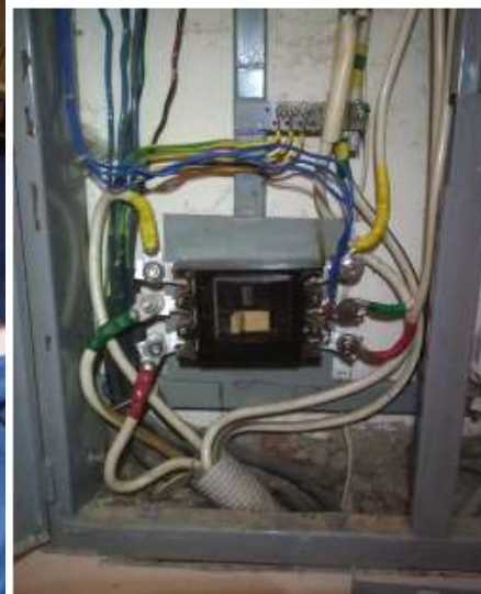
22.04.2021 г. Павловск, пер. Песчаный д. 11/6. Переподключение МФЦ. #жкс2пушкин