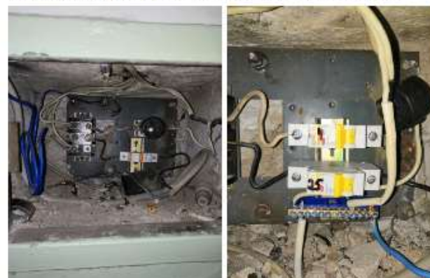
06.04.2021 Ремонт ГРЩ г. Пушкин, Привокзальная пл. д. 2 #жкс2пушкин