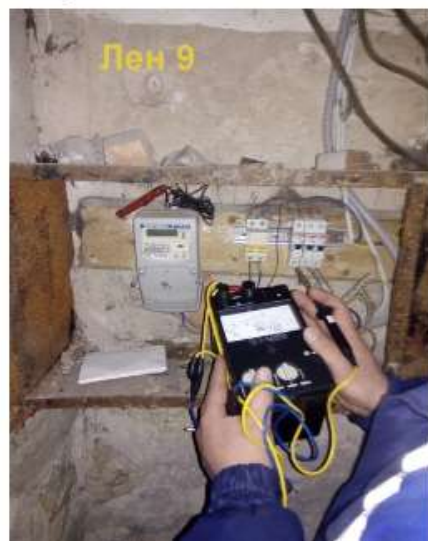
06.04.2021 г. Павловск, Обороны ул. д. 2 пар. 3 ремонт Эл/щитка с заменой автоматов.