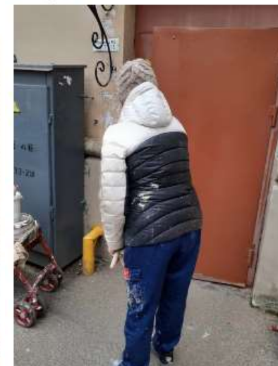
05.04.2021 Ремонт этажного эл/щитка г. Павловск, Толмачева ул. д. 8 #жкс2пушкин