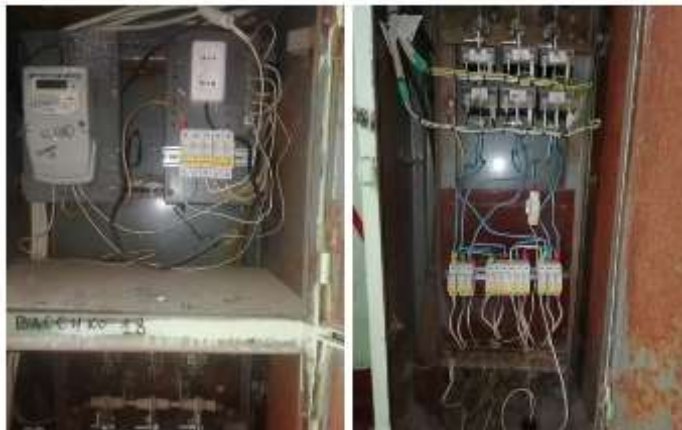
16.04.2021 Окраска входной двери в помещение ГРЩ г. Павловск, Васенко ул. д. 11/6 #жкс2пушкин