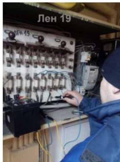
22.04.2021 Ремонт этажного щита г. Пушкин, Салерная ул. д. 36 к 2 #жкс2пушкин