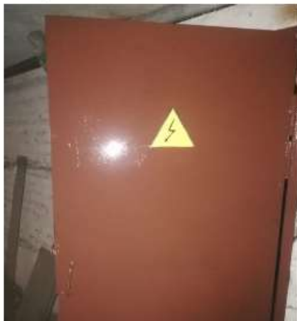
16.04.2021 г. Павловск, ул. Васенко д.11/6 ремонт ГРЩ #жкс2пушкин