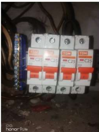
05.04.2021 Замер сопротивления изоляции г. Пушкин, Ленинградская ул. д. 9 #жкс2пушкин