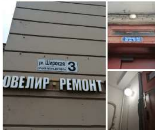
05.04.2021 Окраска подвальной двери г. Пушкин, ул. Конюшенная д. 37 #жкс2пушкин