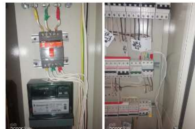
20.04.2021 Установка светодиодных светильников г. Павловск, Динамо #жкс2пушкин #светремонтжкс2